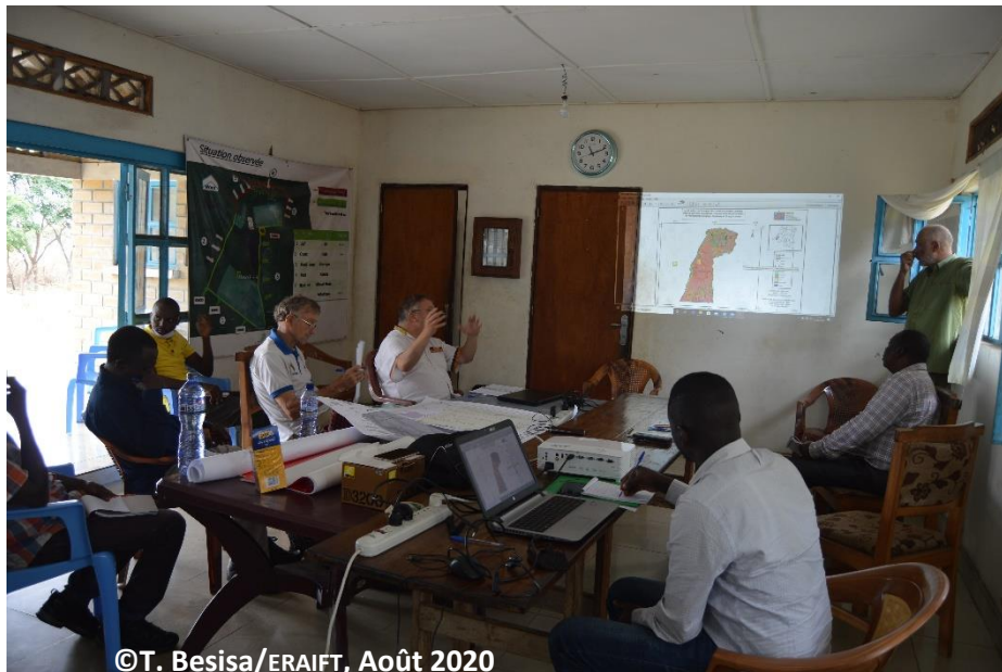
Photo 1. Déroulement de l'atelier

L'ERAIFT présente sa gratitude à l'ICCN et au GI Agro pour leur accueil et l'UE, la GIE, l'USFS et le WCS qui financent formation des 42 apprenants.