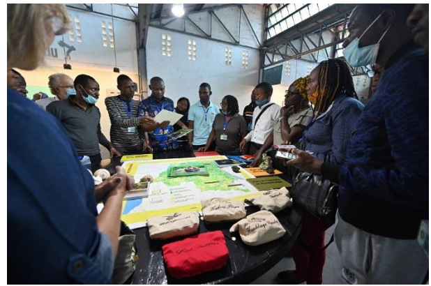
Richesse faunique des Aires Protégées