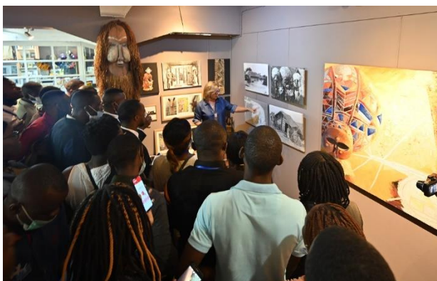
Interprétation des œuvres d'art par Mme Chantal