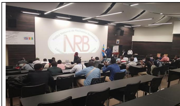
Les apprenants de la 4 e promotion dans l'amphithéâtre de l'INRB pour des explications appropriées des activités qui y sont menées

Enfin, l'ERAIFT remercie sincèrement les responsables de l'INRB pour leur accueil et leur hospitalité. La même gratitude revient à l'Union Européenne et AGRINATURA pour les divers soutiens financiers et techniques.