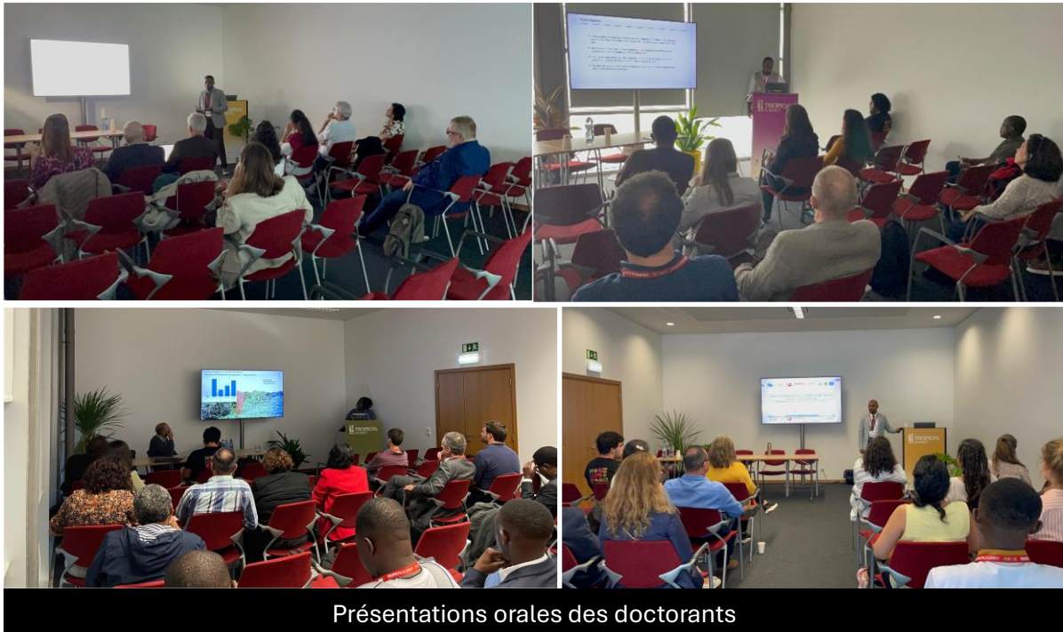
Présentations orales des doctorants