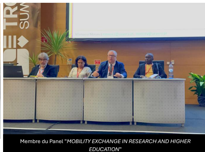
Membre du Panel "MOBILITY EXCHANGE IN RESEARCH AND HIGHER EDUCATION"